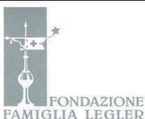
FONDAZIONE FAMIGLIA LEGLER

La Fondazione Famiglia Legler si propone di promuovere la conservazione, lo studio e la valorizzazione della documentazione prodotta dai soggetti economici del territorio bergamasco, partendo dalla consapevolezza del ruolo giocato dall'impresa quale luogo di produzione, organizzazione ed elaborazione di attività economiche, culture organizzative e relazioni sociali. Il sito della Fondazione (2.500 mq. complessivi) rappresenta un mirabile esempio di archeologia industriale, dove le aree dedicate fin dal secolo scorso alla produzione e all'amministrazione sono state trasformate in spazi attrezzati per accogliere archivi, mostre, corsi e convegni.